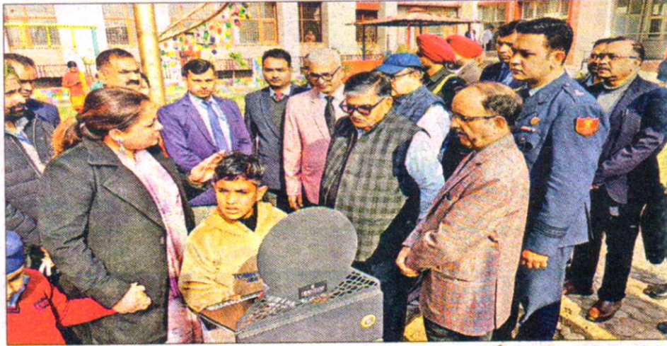
सेंसरी गार्डन का दौरा करने पहुंचे राज्यपाल गुलाब चंद कटारिया।

Amar Ujala (My City Chandigarh) Pg No-03 Col No-02 Date-29-01-2025