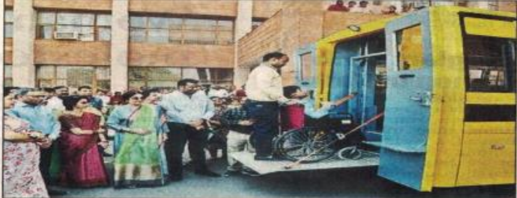
Chandigarh:MP Kirron Kher flags off of a hydraulic bus under MPLADS on Tuesday

Chandigarh: City Member Parliament Kirron Kher on Tuesday flagged off a hydraulic bus from the premises of Government Institute for the Rehabilitation of Intellectual Disabilities, Sector 31, with an aim to make the movement of children with intellectual disabilities easy.