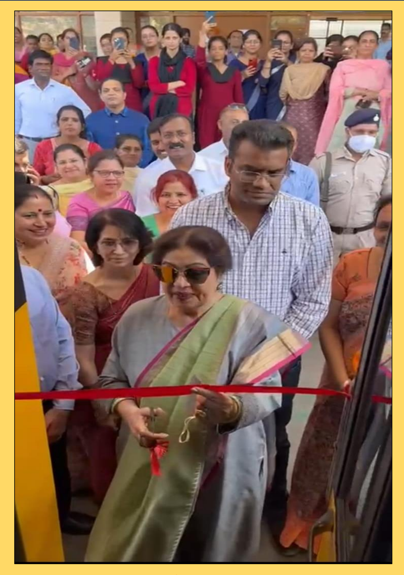
MP Kirron Kher performing ribbon cutting ceremony