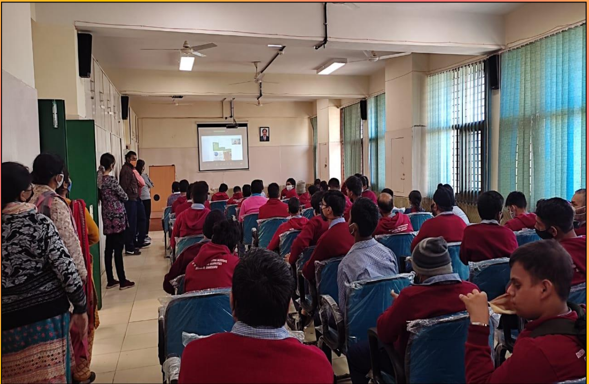
ऑडिटोरियम हॉल में ऑनलाइन प्रदर्शनी देख रहे एकेडमिक स्टाफ्स एवं विशेष आवश्यकता वाले बच्चे।