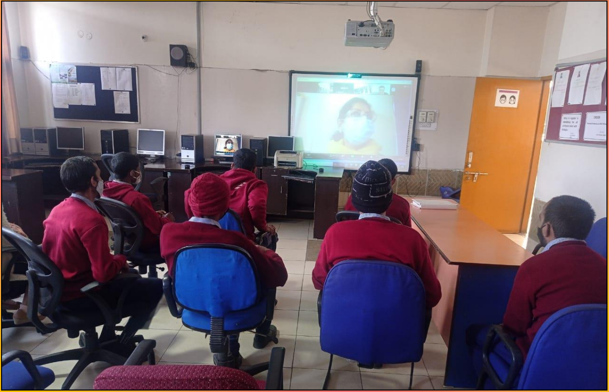
आईटी रूम में ऑनलाइन प्रदर्शनी देख रहे विशेष आवश्यकता वाले बच्चे।