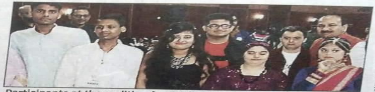
Participants at the audition for 'Walk With A Difference'

Thirty of the best talents were selected for a week-long capacity building programme at Manovikas Kendra Rehabilitation and Research Institute for the Handicapped, under the guidance of mental