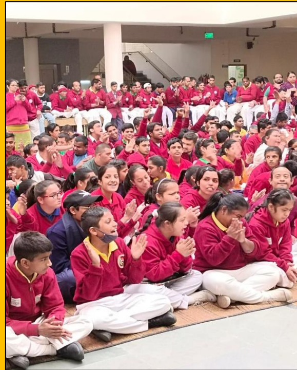
मैजिक शो का लुप्त उठाते हुए विद्यार्थीगण