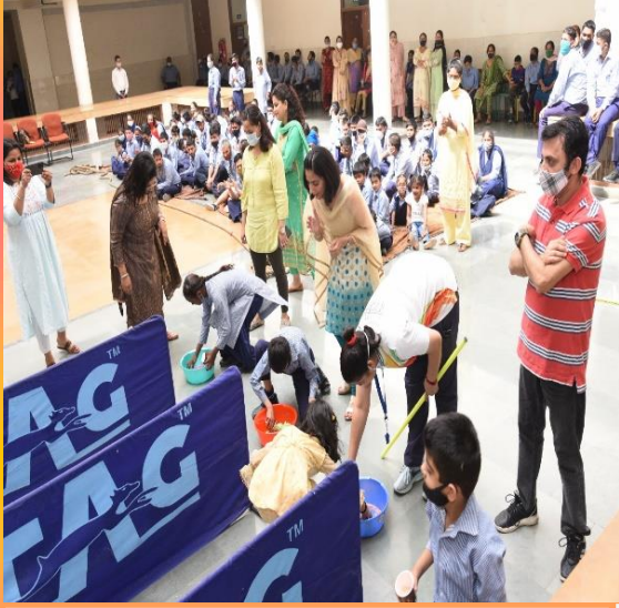
सैंड गेम में भाग लेते हुए संस्थान के विशेष विद्यालय के विद्यार्थी गण।