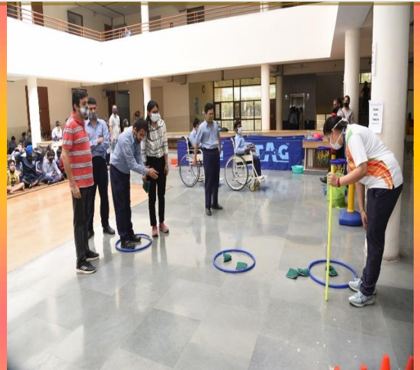
GRIID school students playing Bean Bag Throw