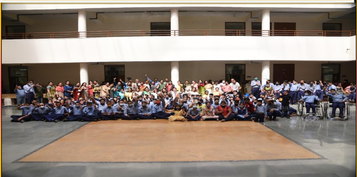
मुख्य अतिथि के साथ ग्रिड स्टाफ एवं विद्यार्थी गण।