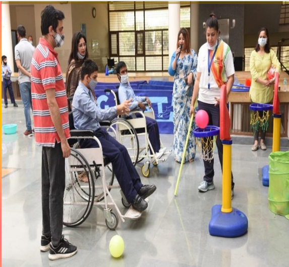
बॉल इन द बास्केट गेम में भाग लेते हुए व्हीलचेयर स्टूडेंट्स।