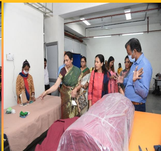
मुख्य अतिथि शेल्टर वर्कशॉप की सिलाई यूनिट का दौरा करते हुए। इस यूनिट में अस्पतालों में इस्तेमाल होने वाले गाउन, स्प्लिट सीट्स एवं मास्क इत्यादि तैयार किए जा रहे हैं।