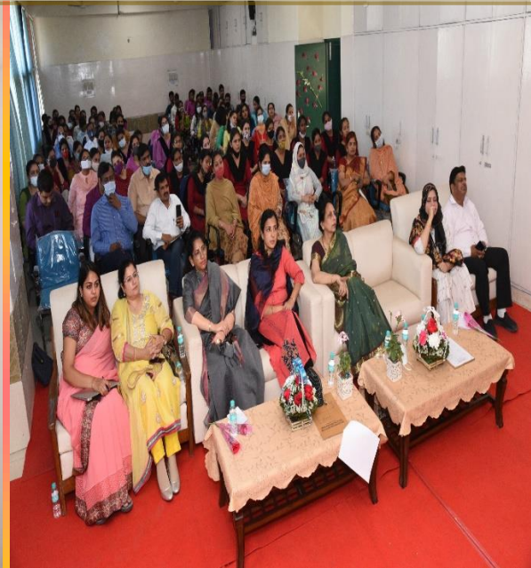
डॉ बीएस चवन मल्टीपर्पस हॉल, ब्लॉक सी, ग्रिड में आयोजित कार्यक्रम में अधिकारीगण प्रतिभागी, ग्रीड स्टाफ एवं कॉलेज के विद्यार्थी।