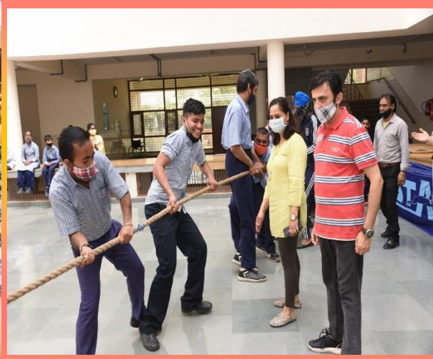
टग ऑफ वार गेम्स में भाग लेते हुए प्रतिभागी।