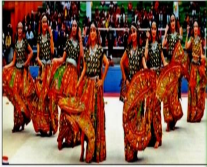
पंजाब यूनिवर्सिटी स्थित जिन्मंत्रिग्राम हॉल में स्पोर्ट्स मीट के दौरान नृत्य की प्रस्तुति देती छात्राएं। संवाद

उद्घाटन मौके पर स्कूल की छात्राओं ने लोक नृत्य पर लक्ष्मण प्रस्तुति देकर ऑडिटोरियम में टेबल टेनिस और बैडमिंटन में हाथ अगम्य। छात्रों का