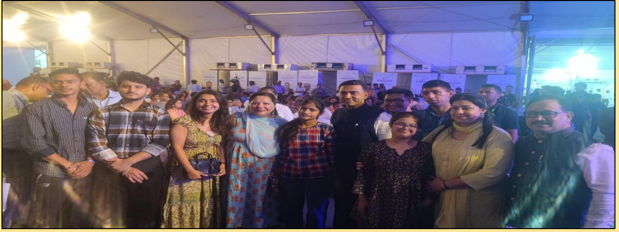
गोवा के माननीय मुख्यमंत्री डॉ प्रमोद पांडुरंग सावंत एवं समाज कल्याण विभाग के मंत्री श्री सुभाष पहल देसाई के साथ एस ओ बी चंडीगढ़ के बैनर तले संस्थान के छात्रगण।